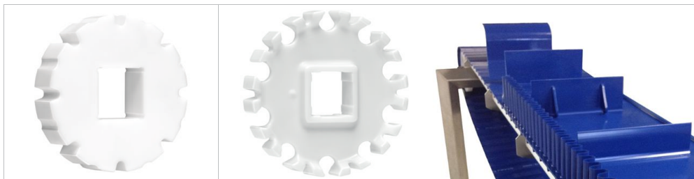
Pignons Série Habasis® Cleandrive