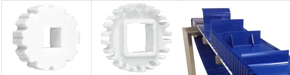
スプロケット ハバジット クリーンドライブ™ シリーズ