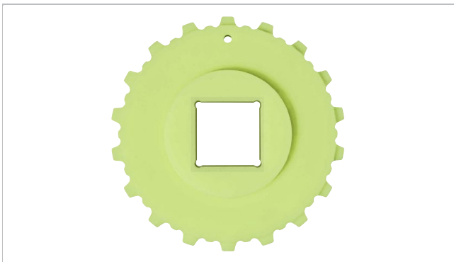
一体型スプロケット (ソリッド)