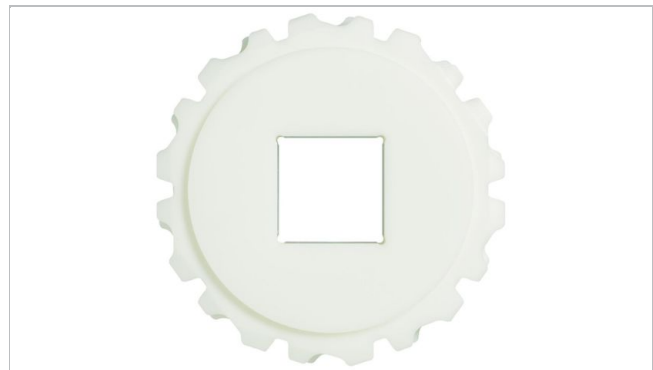
分割スプロケット