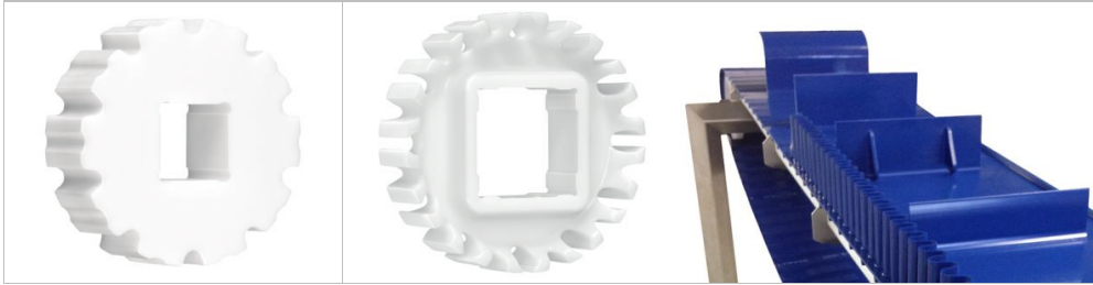
链轮 Habasit® Cleandrive series系列