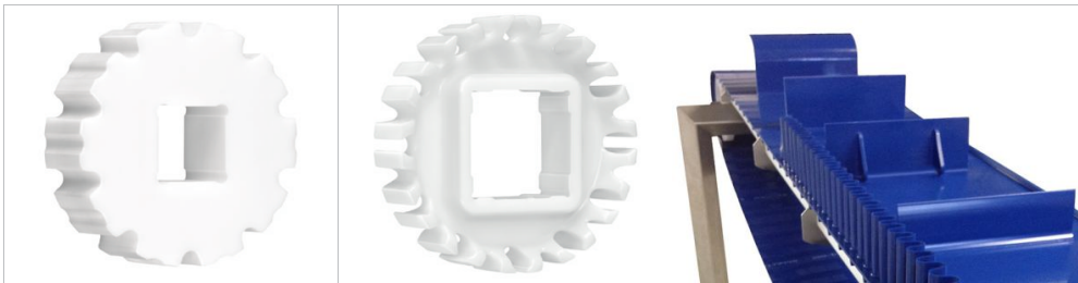
Piñones Habasit® CleandriveSerie