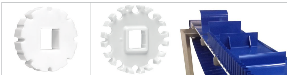
Piñones Habasit® CleandriveSerie