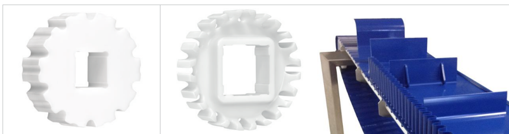
Pignoni Serie Habasit® Cleandrive

Questo prodotto non è stato testato in accordo agli standard ATEX (atmosfera con rischi di esplosione - regolamento ATEX 95 oppure direttiva EU 2014/34) e quindi è soggetto all'analisi ambientale da parte dell'utilizzatore