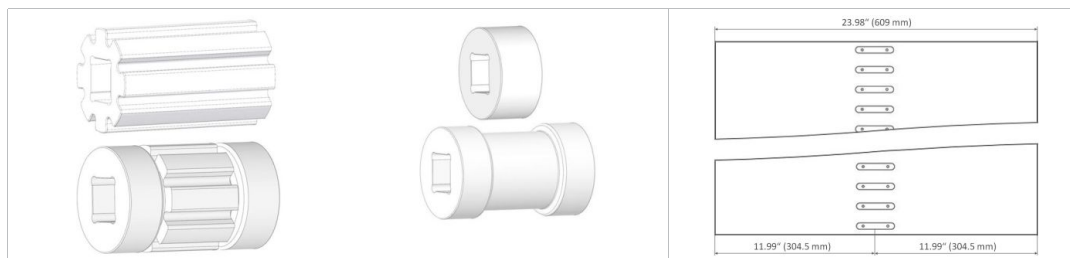
Pignoni Serie Habasit® Cleandrive

Questo prodotto non è stato testato in accordo agli standard ATEX (atmosfera con rischi di esplosione - regolamento ATEX 95 oppure direttiva EU 2014/34) e quindi è soggetto all'analisi ambientale da parte dell'utilizzatore