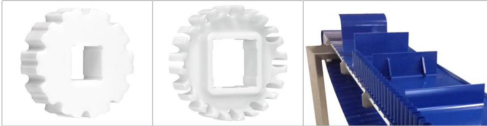
スプロケット ハバジット クリーンドライブ™ シリーズ