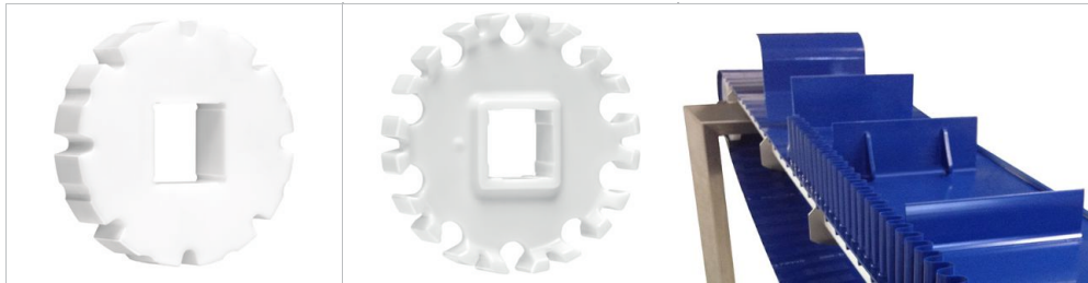
スプロケット ハバジット クリーンドライブ™ シリーズ