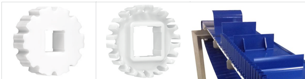
スプロケット ハバジット クリーンドライブ™ シリーズ