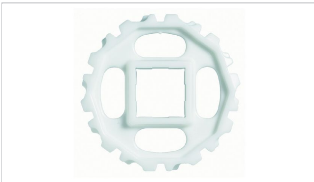
一体型スプロケット (“窓あき” スプロケットの配列