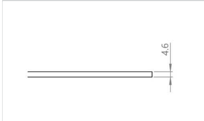
Sketch of basic shape